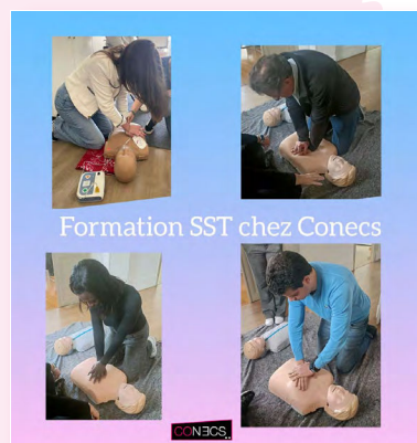
Formation SST chez Conecs

Fin mars, une grande partie des collaborateurs de Conecs a suivi une formation de « Sauveteur Secouriste au Travail » avec Point Org Sécurité, incluant de nombreuses mises en situation. Cette formation apporte un environnement de travail rassurant mais peut également s'appliquer à la vie de tous les jours. Chez Conecs aussi, la sécurité, c'est l'affaire de tous !